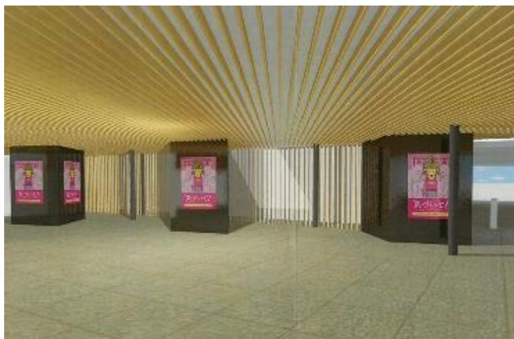
※改札外デジタルサイネージ(イメージ)