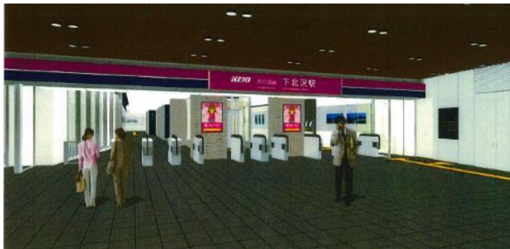
※改札内デジタルサイネージ(イメージ)