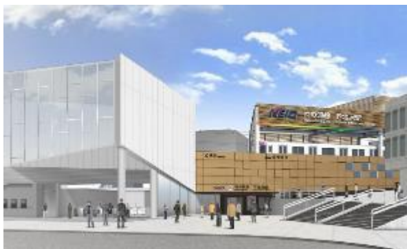
※京王中央口の共用開始は2019年3月16日(土)から

京王井の頭線 下北沢駅 の駅改良工事に伴い、新しくデジタルサイネージ広告が設置されます。 詳細については下記および次項以降をご確認ください。