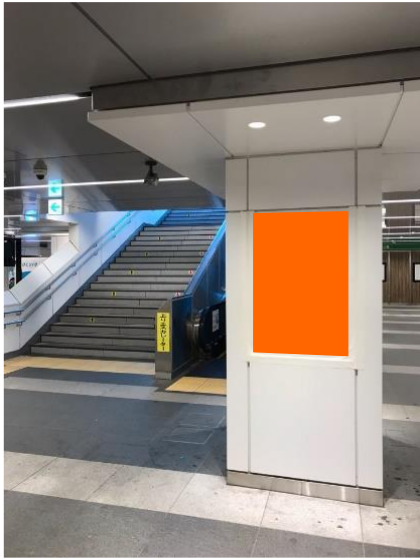
当て込みはイメージです。